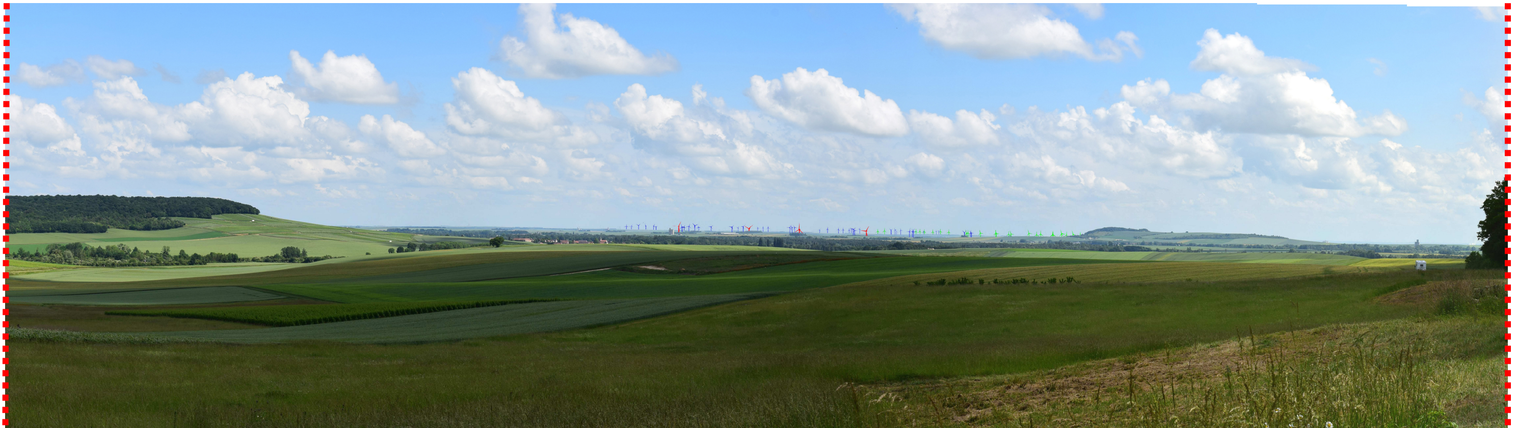
Photomontage d'interprétation recadré à 60°