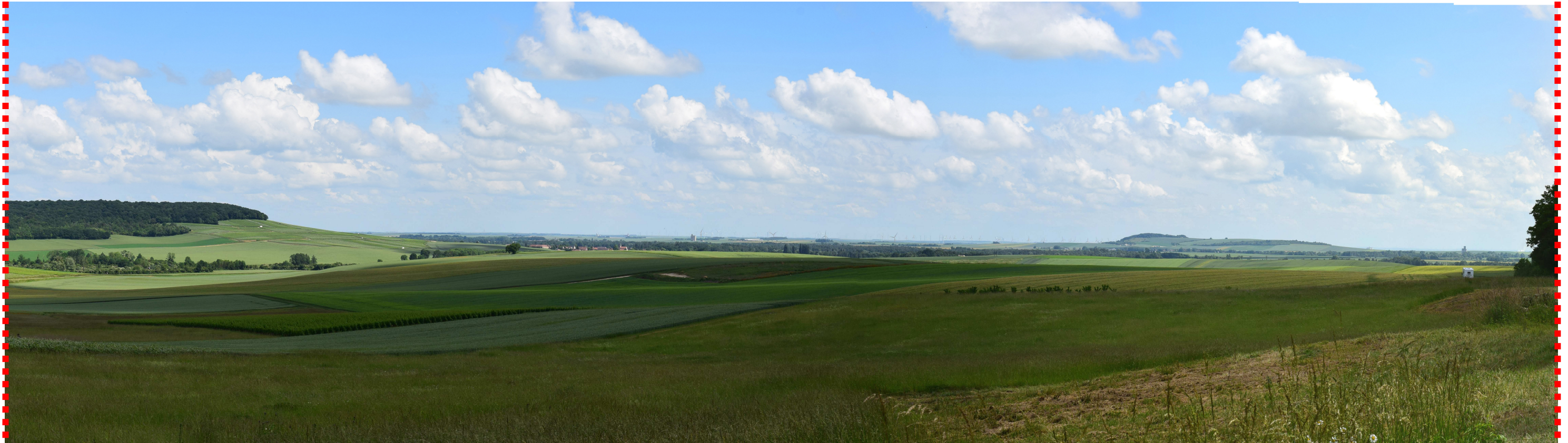
Photomontage recadré à 60°